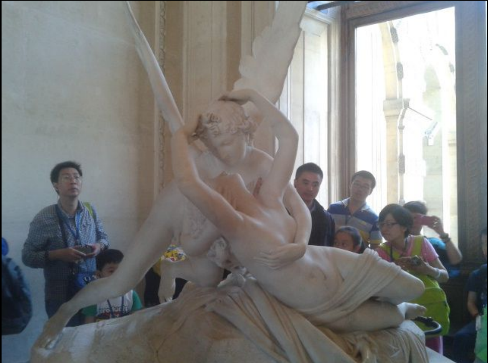
Canova - Amore e psiche (1788-'93)