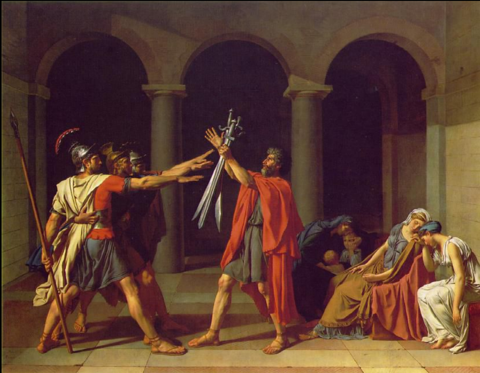
David - Il giuramento degli Orazi (1784)